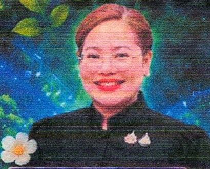
ดร.เทศทิพย์ สุควาณิช อธิบดีกรมส่งเสริมการเรียนรู้

“ร่วมส่งพลังเสียง พลังใจ ก้าวสู่ความยั่งยืนที่ดีต่อ น้ำกับป่า วางรากฐานของชีวิต เพื่ออนาคตที่ยั่งยืนของลูกหลานไทย”