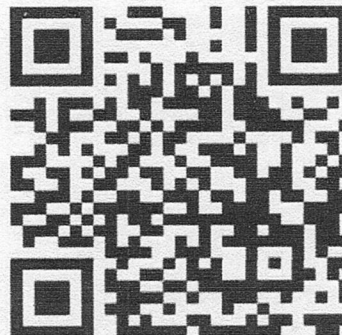
แบบตอบรับการเข้าร่วมอบรมโครงการฯ