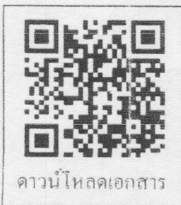
ดาวน์โหลดเอกสาร