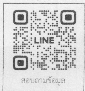
สอบถามข้อมูล