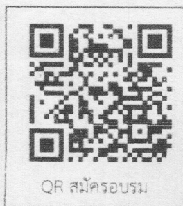
QR สมัครอบรม