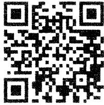
วาระที่ ๑-๔