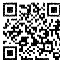
วาระที่ ๕(ต่อ๔) - วาระที่ ๖