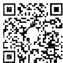
รายงานผลการตรวจสอบ