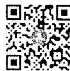
ลงทะเบียนผู้ยื่น