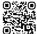
การขอรับเครื่องหมาย เชิดชูเกียรติฯ