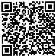
แบบประเมินฯ